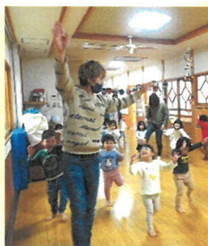
リズム運動の時間

初めての参観、すごく楽しかったです。おやつのお時間におかわりをしようかどうしようか悩んでいる姿や周りのお友だちを見ながら何かを考えていたり、普段とは違う様子が見られて良かったです。おやつのお時間の牛乳、家でもやってみようと思います。